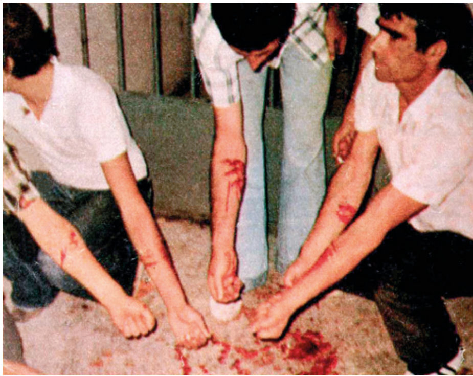
Presoak autolesioak egiten Kordobako espetxean, 1977ko udazkenean.

Eten hori baliatu zuen, hain zuzen ere, 1982an bere bizitza goitik behera