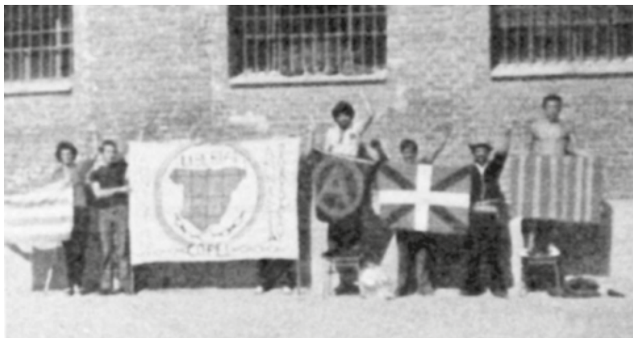
1977an presoak mutinatu eta Carabancheleko teilatua hartu zutenean, igo aurretik argazkia egin zuten bost ikurrekin: COPELena, anarkista eta Herrialde Katalanetako, Galiziako eta Euskal Herriko bandera bana.

COPELeko kideak jipoitu, sakabanutu eta isolatu zituzten, kogestioa baztertu eta diziplina zorrotza berrezarri zuten espetxeetan. Ordurako heroina