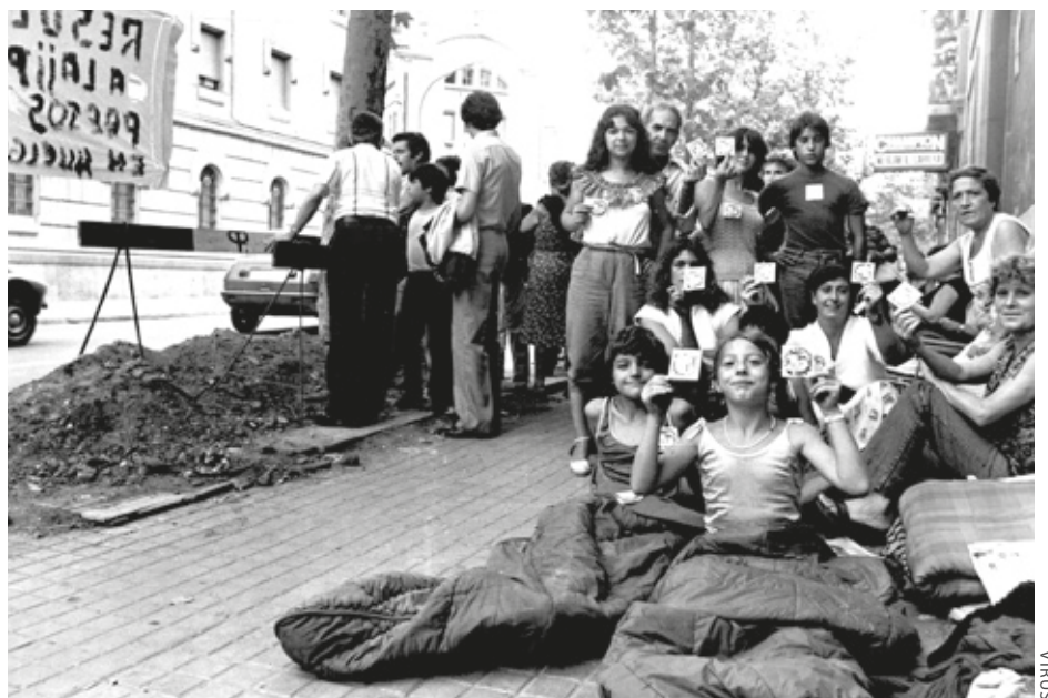
Presoen senideak espetxean piztutako borroka bati sustengua adierazten.

Amnistia aldarrikatu edo espetxearen aurka borrokatzeaz gain, presoen arteko harremana ere eraldatzeko borrokatu zen koordinadora. “Espetxeko bizitza berrantolatzen saiatu ginen, kanpoko gizartea ez birproduzitzeko: errespetua, abusurik ez, asanbladak,